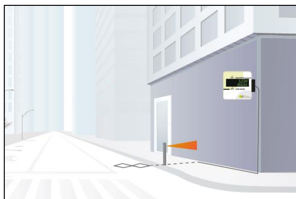
Eco-Display Compact na zdi a sčítač MULTI